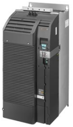
Figura similar / Figure similar