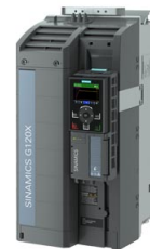
Figura similar / Figure similar