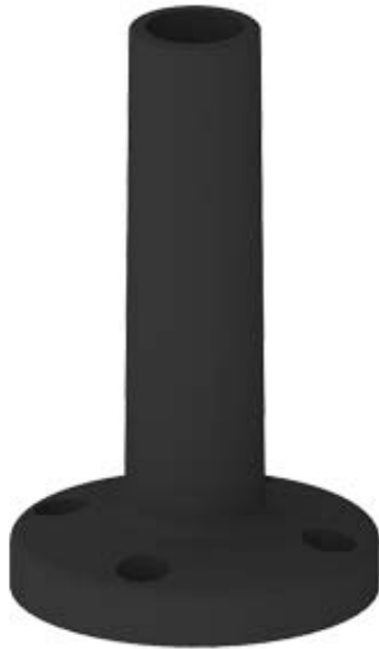
COLUMNAS DE SENALIZACION, DIAMETRO 70MM ACCESORIO ZOCALO CON TUBO (100MM)