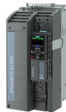
Figura similar / Figure similar