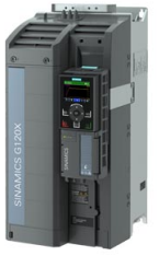
Figura similar / Figure similar