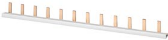
Similar a la ilustración

BARRA COLECTORA CLAVIJA PROTEGID CONTRA CONTACT, 10 MM2 TRIFASICA, 214 MM LONG CON TAPAS FINALES