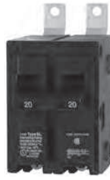
2 - Polo