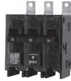
3 - Polo